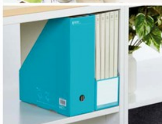
FILE BOX ファイルボックス (スタンドタイプ)