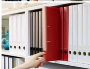
RING FILE リングファイル