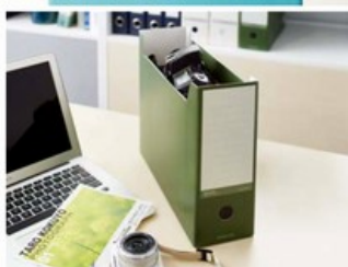
FILE BOX ファイルボックス