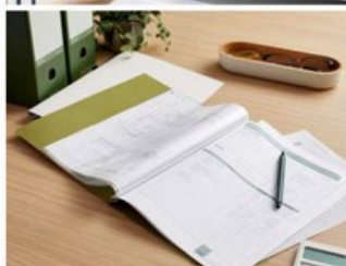
FLAT FILE フラットファイル