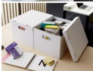
STORAGE BOX 収納ボックス